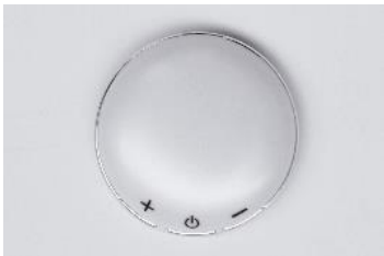
Κύρια συσκευή (μπροστά και κουμπιά)