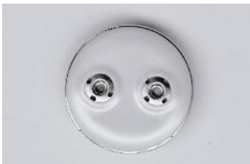
Κύρια συσκευή (πίσω)